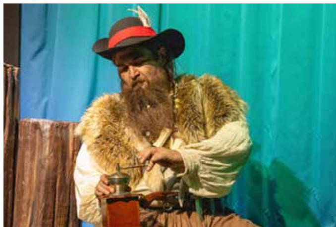
Szenenfoto aus „Der Räuber Hotzenplotz“

Ob auf Ihrem Rechner oder mobil – auf unserer Homepage gibt es immer Neuigkeiten und weiterführende Informationen zu unseren Theaterstücken, Gastspielen und Konzerten.